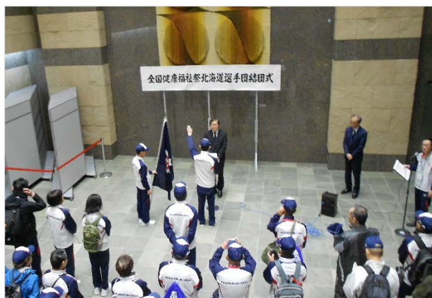
北海道選手団結団式

令和元年11月9日から12日までの4日間、和歌山県内で全国健康福祉祭和歌山大会（ねんりんピック紀の国わかやま2019）が開催されました。今年も道内の予選会の記録を参考に選出された20種目の競技から125名（札幌市居住者を除く）が北海道選手団として参加し、同じスポーツを楽しむ全国の仲間との交流を深めてきました。結果は、男子10kmマラソン及び女子水泳80歳以上バタフライ50mでそれぞれ第1位となり、他の選手も含めて日ごろの練習成果を存分に発揮しました。